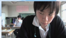
監督・脚本・撮影・編集:飯塚花笑 時間:75分

性同一性障害の高校生、優は女子制服を着る毎日、第二次性徴期を迎えた自分の身体を受け入れられずひとり悩んでいた。男として生きることを許されず苦しむ優にとって救いは思いを寄せる真澄との手紙のやりとり。ところがそれを男子クラスメイトに読まれ、その日から優は嫌がらせを執拗に受けるように。女である自分を恨みながら優は現実と必死に向き合おうとする。ボクがボクであるためにすべきことは?