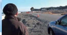
製作:山本 蘭 監督・撮影・編集:島田 暁 時間:18分

2011年の3月11日に発生した東日本大震災により、津波による甚大な被害と福島第一原子力発電所の事故により、大混乱に陥った福島県いわき市。同市を拠点に活動を続ける「gid.jp 日本性同一性障害と共に生きる人々の会」南東北支部の人々が直面する現実を、交流会やインタビュー取材を通して記録。GID(性同一性障害)学会第14回研究大会にて上映。